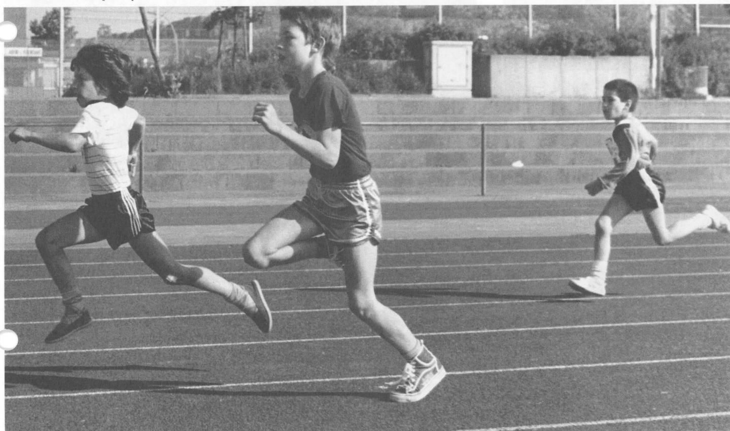
Kurzstreckenlauf beim Schülersportfest: Mit vollem Einsatz stürmen diese drei Jungen dem Ziel entgegen.

neue Rekord-Teilnehmerzahl beziffert sich auf 130. Nicht nur darüber freute sich unser Sportwart: „Das Sportfest mit dem HM-Nachwuchs macht mir besonders viel Spaß.“